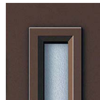
ポスト付子扉04デザイン額縁 額縁は親扉M01~03デザインの 採光部額縁と同形状