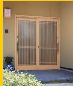
リフォーム玄関引戸 れん樹RH