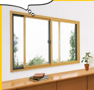
プラマードU 1窓 (サイズ:中)