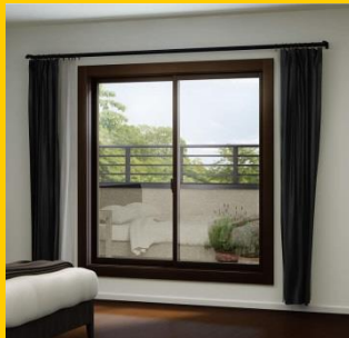
スマートカバー工法 1窓 (サイズ:大)